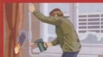
Отогревание замерзших труб паяльными лампами и факелами