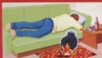
Курение в постели