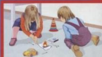
Шалость детей с огнем

Огнетушитель порошковый ОП-2 Предназначен для тушения всех видов пожаров.