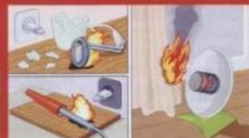
Оставленные без присмотра электронагревательные приборы